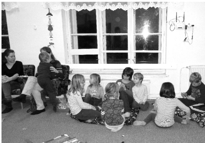
Foto z vánočních dílen