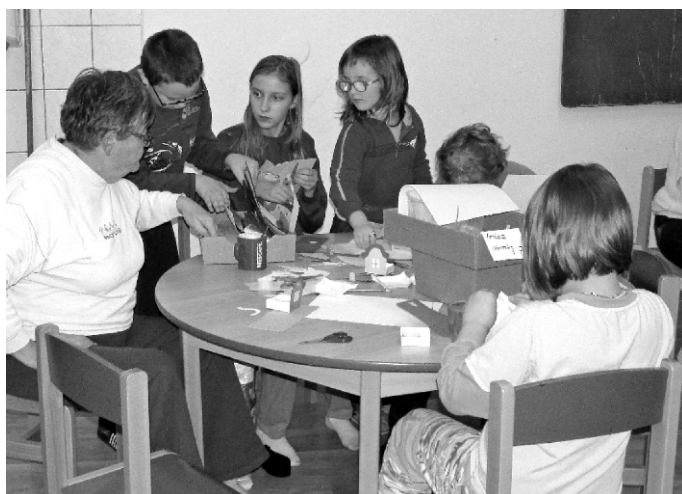
Foto z rozsvícení vánočního stroměčku 27.11.2015